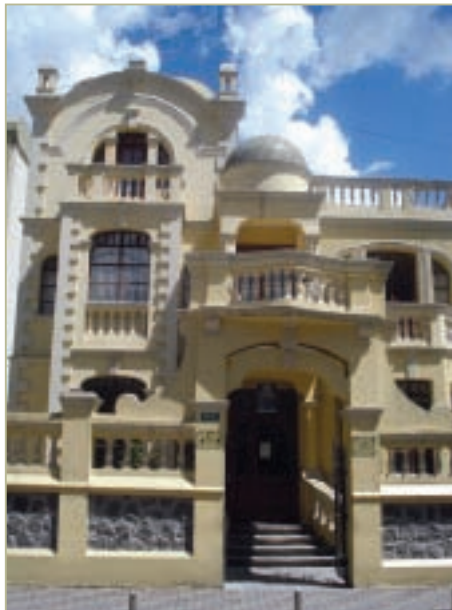
■ La Casa Amarilla, sede del Centro de Mediación, creado por el Procurador Jiménez e impulsado por el Procurador Borja.

A continuación, expuso los que estimaba sus principales logros al servicio del Estado: