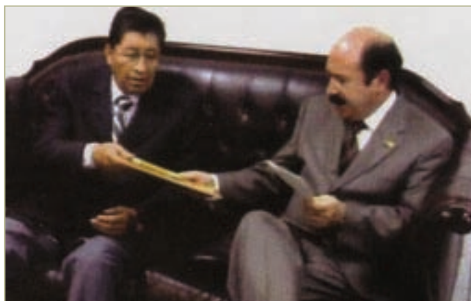
■ El Procurador General del Estado entrega su informe de labores al Presidente del Congreso, Dr. Wilfrido Lucero Bolaños.