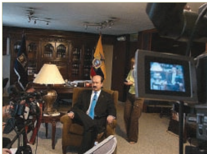
■ El Dr. José María Borja en su despacho de la Procuraduría General del Estado.

En el período constitucional 2003-2007, el Estado dejó de pagar una suma superior a los mil millones de dólares, por contenciosos instaurados en su contra, gracias a la oportuna y eficaz intervención de la Procuraduría General del Estado en la vigilancia de los 55.804 procesos judiciales y de las actuaciones de los tribunales, magistrados y jueces.